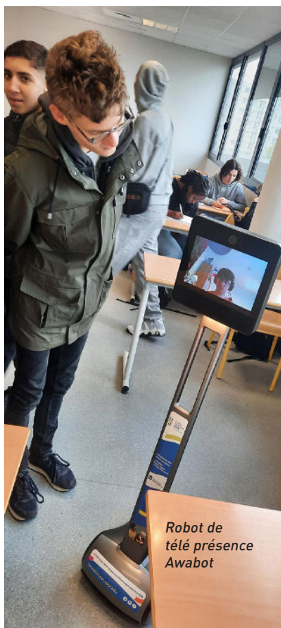
Robot de télé présence Awabot