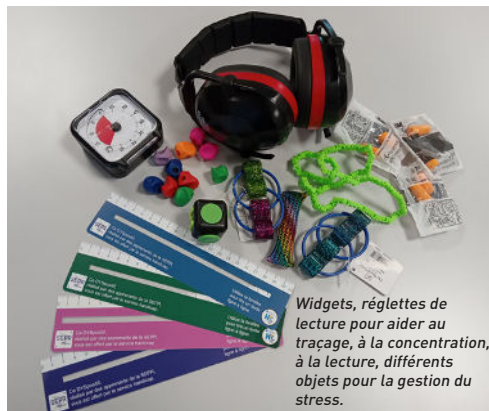
Widgets, règles de lecture pour aider au traçage, à la concentration, à la lecture, différents objets pour la gestion du stress.